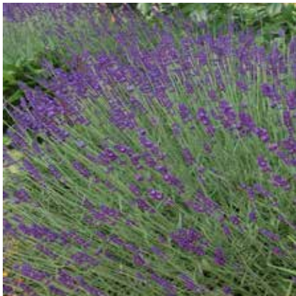
Lavandula angustifolia – Bescheidenheit, Tugend, Demut