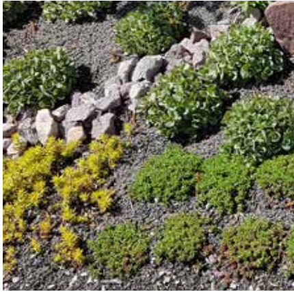
Sempervivum ssp. – Hauswurz Schutz gegen Dunkle Mächte (Blitz und Donner), ewiges Leben