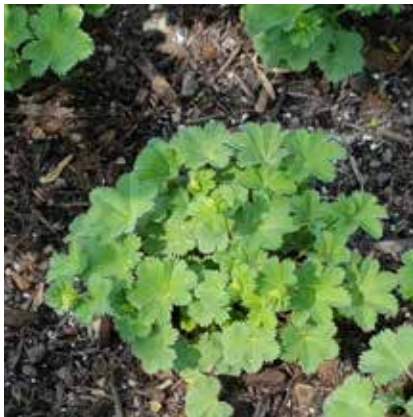
Alechemilla Mollis – Weicher Frauenmantel Symbol: Zauberkraft