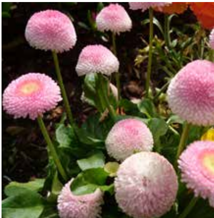
Bellis perennis- Gänseblümchen, Tausendschön – Unschuld, Be- scheidenheit des Kindes und ewiges Leben